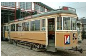
Efterårsudflugt til sporvejsmuseet